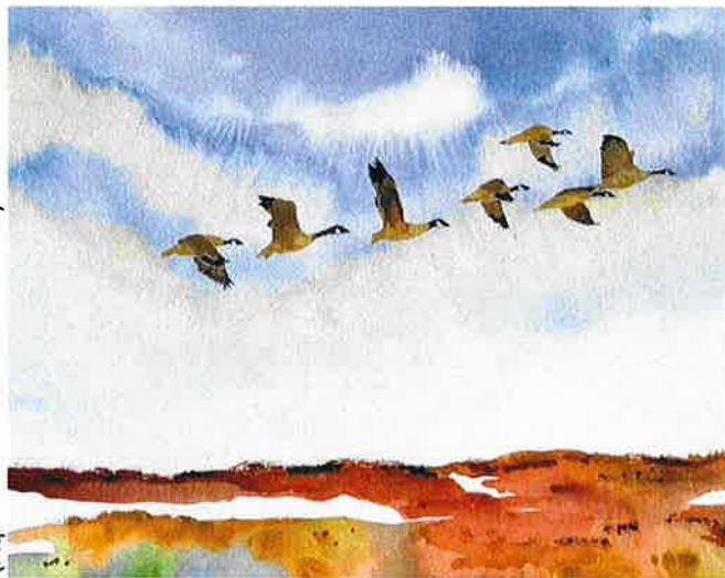
(Aquarelle de Claudia Dumont)

Vos coin-coin mélodieux à chaque fois m'étonnent